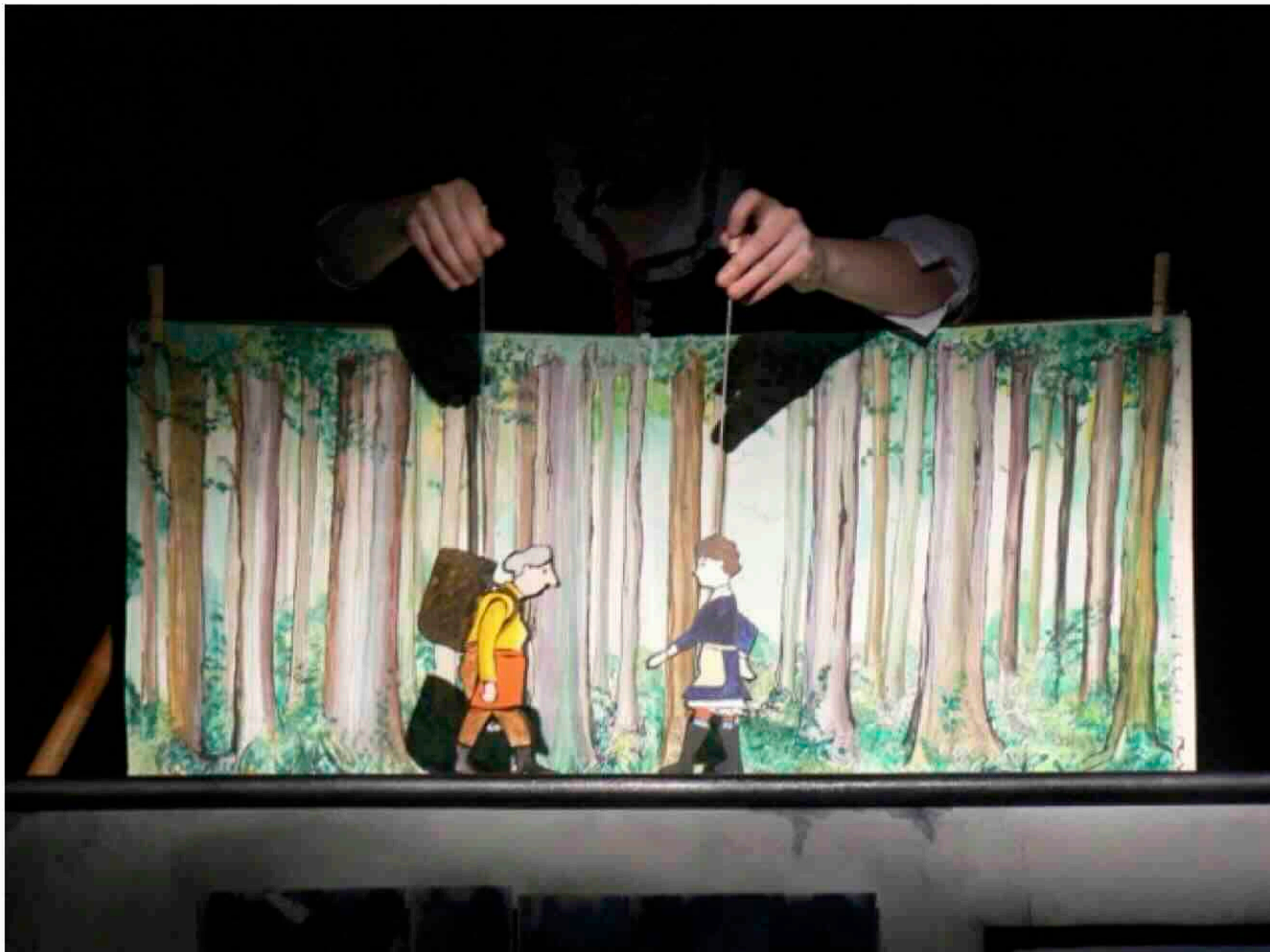
Spot auf Buch

Die Discokugel und der Ventilator (bringen wir mit) sollen vom Lichtpult aus gesteuert werden können, also auf einen Regler gespeichert werden. Oft wird für den Motor der Kugel ein zusätzlicher Ballast in Form einer kleinen Lampe benötigt.